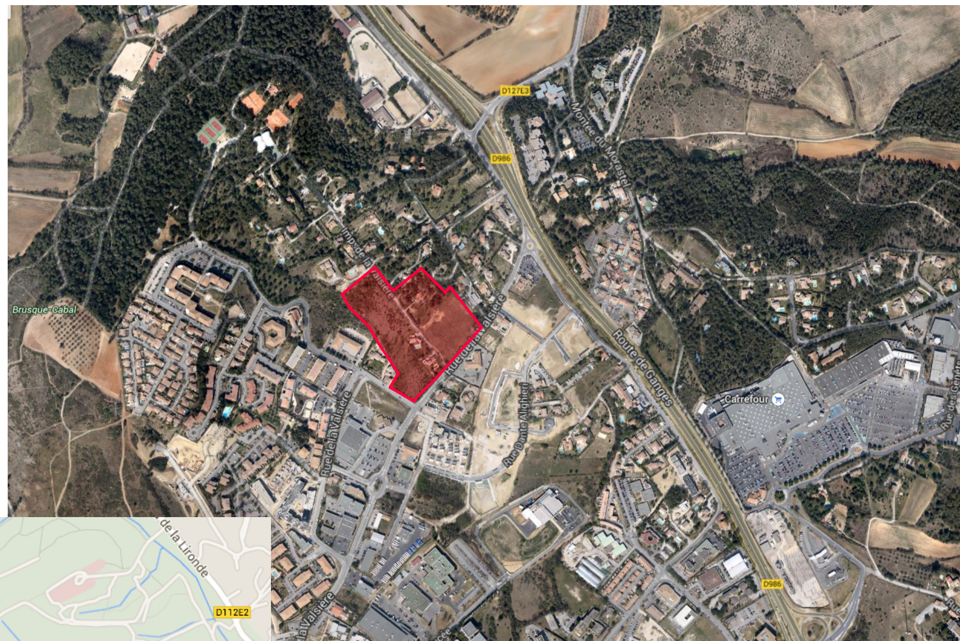
VUE AERIENNE ECH.1/12 000e

Adresse du terrain : Rue de la Valsière - Grabels