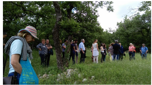
Déambulation sur le circuit des belvédères de Blandas