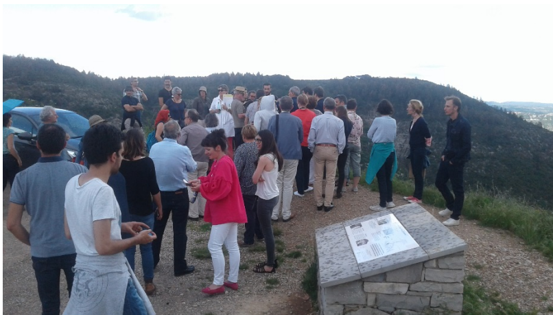
Présentation d'un exemple d'ouverture des milieux, les travaux et le suivi par l'observatoire photographique des paysages, CPIE des causses méridionaux