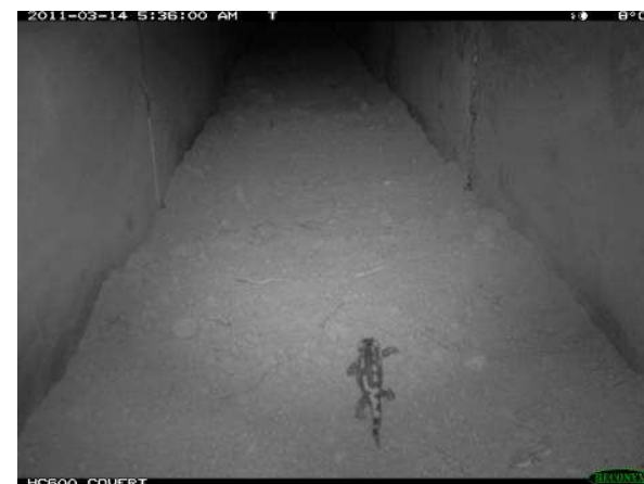
Eco-duc d'A7 et salamandre dans l'ouvrage