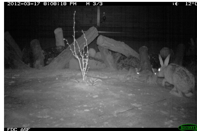
Eco-pont d'A7 et lièvres sur l'ouvrage