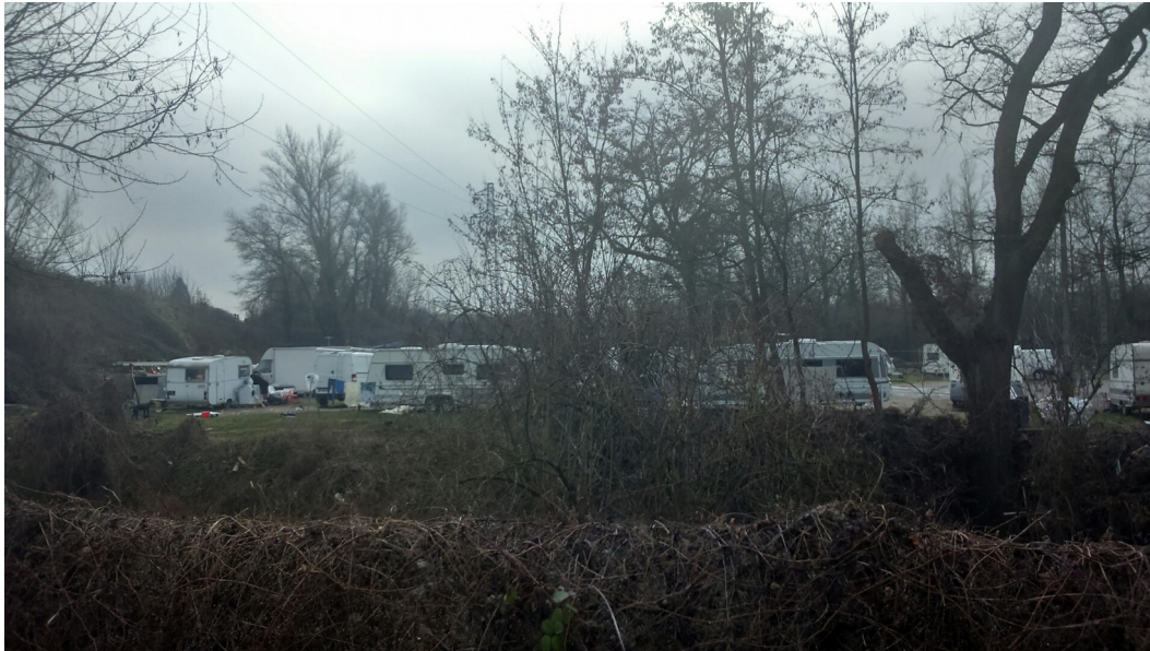
Schéma départemental depuis 2002 : création d'une aire d'accueil de 20 places + MOUS pour les personnes occupant le camp → aucune action jusqu'en 2017 (problème terrain)