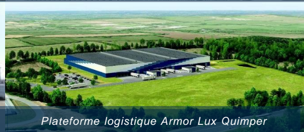
Plateforme logistique Armor Lux Quimper