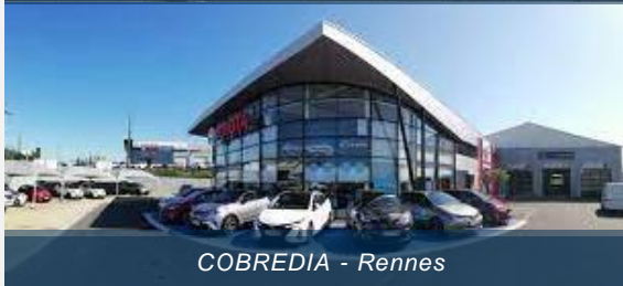
COBREDIA - Rennes