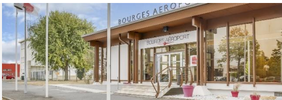
Quartier Aéroport de Bourges

Conseil , Due Diligence technique, Digitalisation de la gestion immobilière