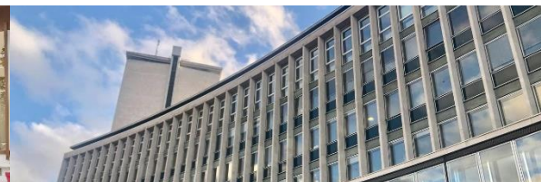
Hôtel du département de la Seine-Maritime