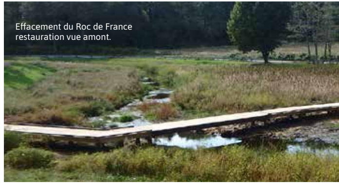
Effacement du Roc de France restauration vue amont.

La libre circulation est à rétablir dans les deux sens, sur les ouvrages hydroélectriques, des dispositions sont à prendre pour éviter la mortalité des poissons dévalant par les turbines (plan de grille et exutoire ou turbine ichtyo-compatible).