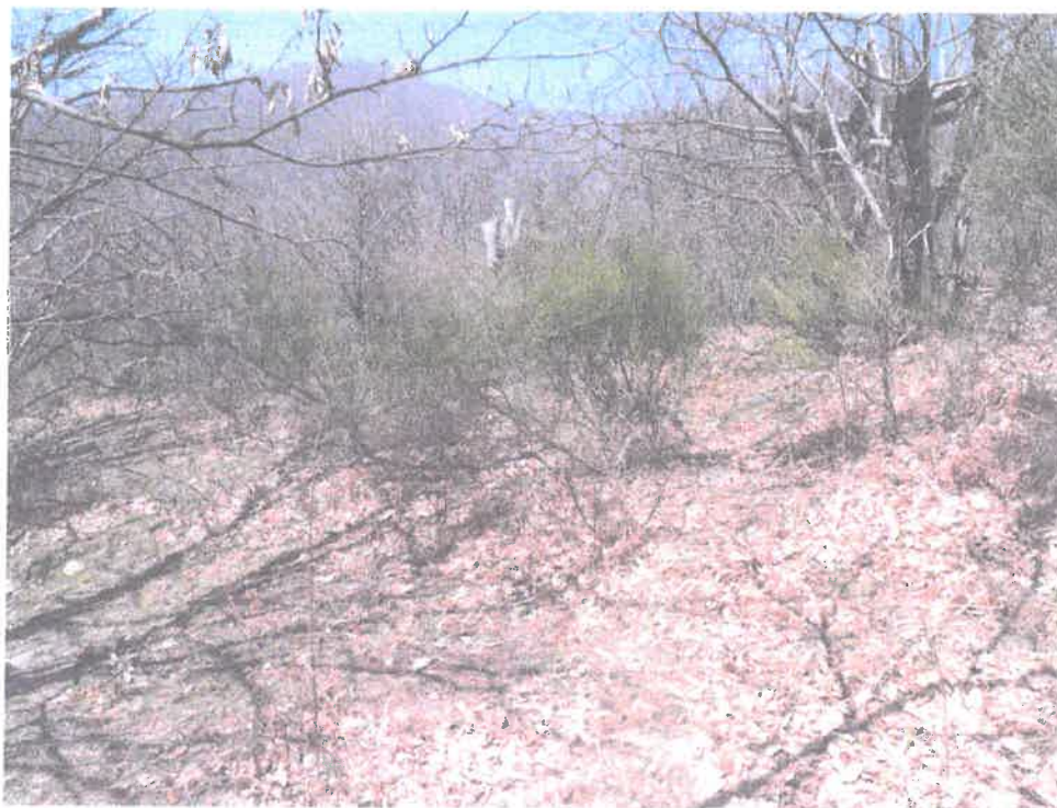
Parcelle A 560- Photo prise le 5 avril 2013 - Sud/Nord