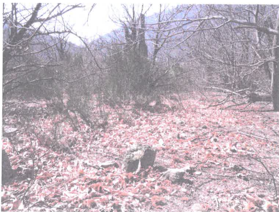
Parcelle A 560- Photo prise le 5 avril 2013 - Nord/Sud