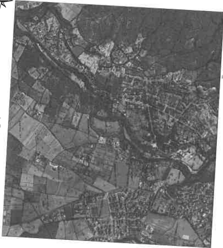
Echelle : 1/10000 ème