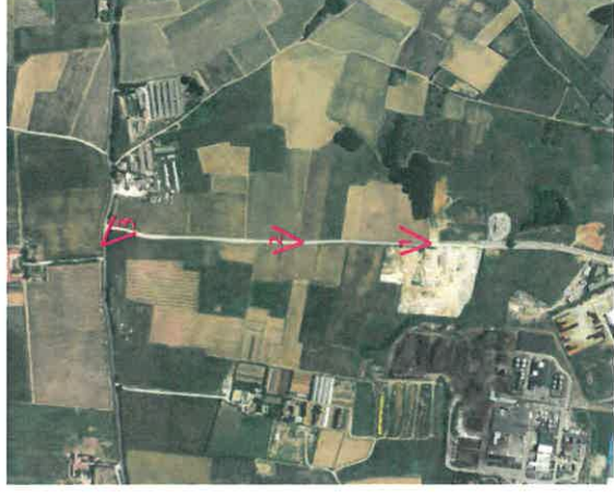
Localisation des prises de vue