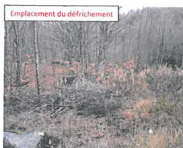
N°2 Date de prise : 14-12-2011