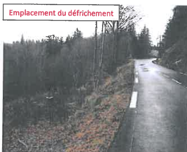
N° 1 Date de prise : 14-12-2011