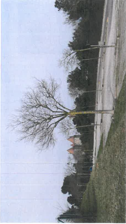
L'esplanade du parking

Le projet continue dans la logique des matériaux utilisés pour l'aménagement de l'hôtel du Pont Levis, l'acier corten, le béton balayé, le bois, le stabilisé enrichie et surtout le végétal sont les invités pour la requalification de cet espace.