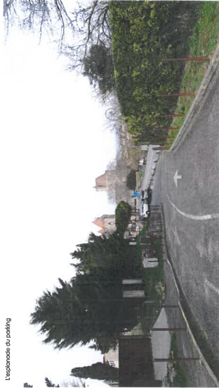
L'esplanade du parking