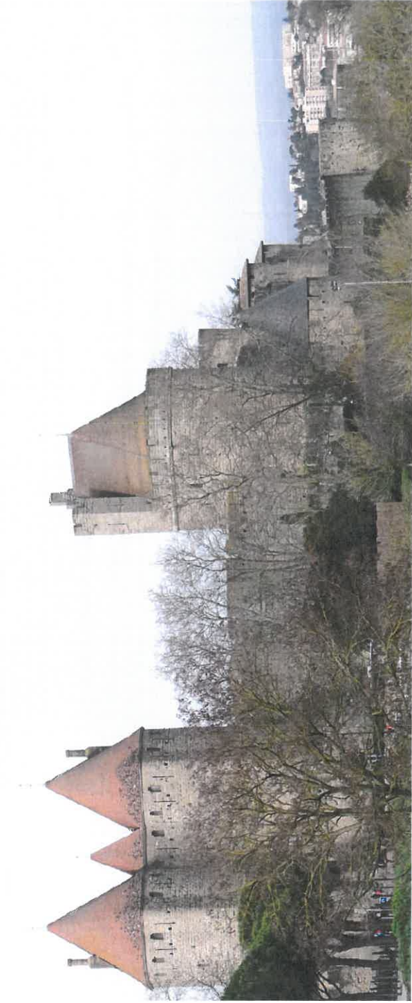
Création du nouvel accès du parking Paulard et traitement paysagé de l'ensemble de l'aire de stationnement. Permis d'aménager... 29 septembre 2014

GRUJANNE - Architecture et Paysage Roger Grujanne Architecte paysagiste