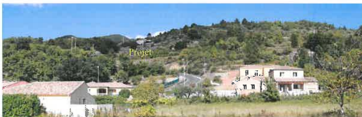
Cliché 1 - Vue depuis la RD 25