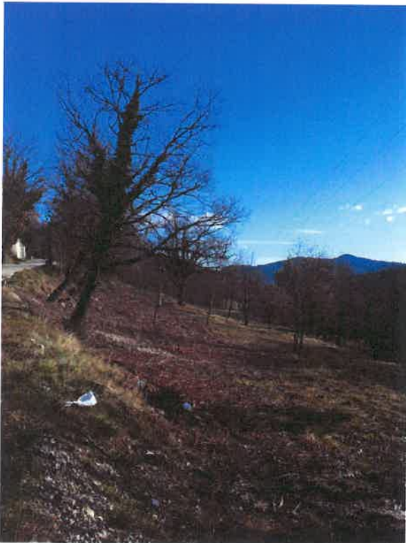
Photographie n°2 (environnement proche)