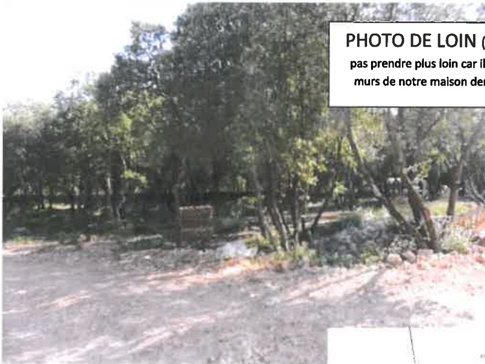
PHOTO DE LOIN (ne peut pas prendre plus loin car il y a les murs de notre maison derrière)