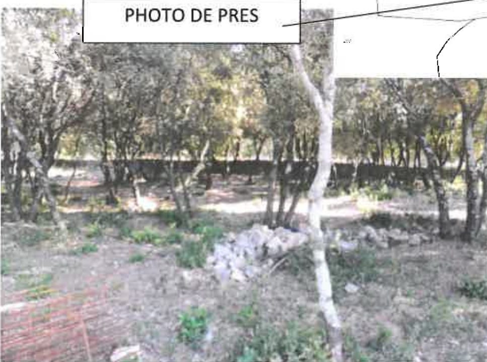
PHOTO DE PRES