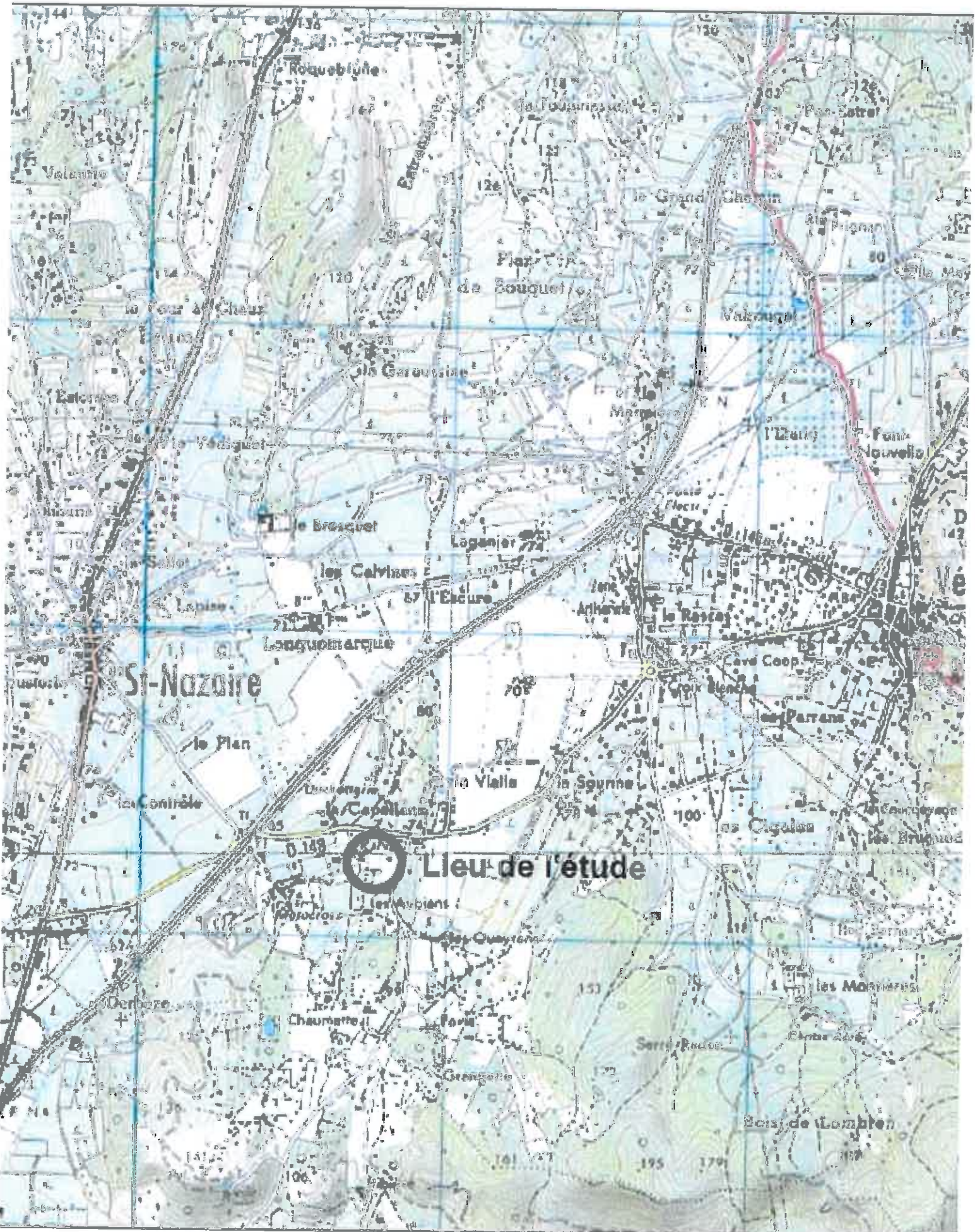
(extrait de la carte IGN de PONT SAINT-ESPRIT au 1/25000)

onnées GPS sont : Longitude 4°38'10.14"E ; Latitude 44°11'23.1