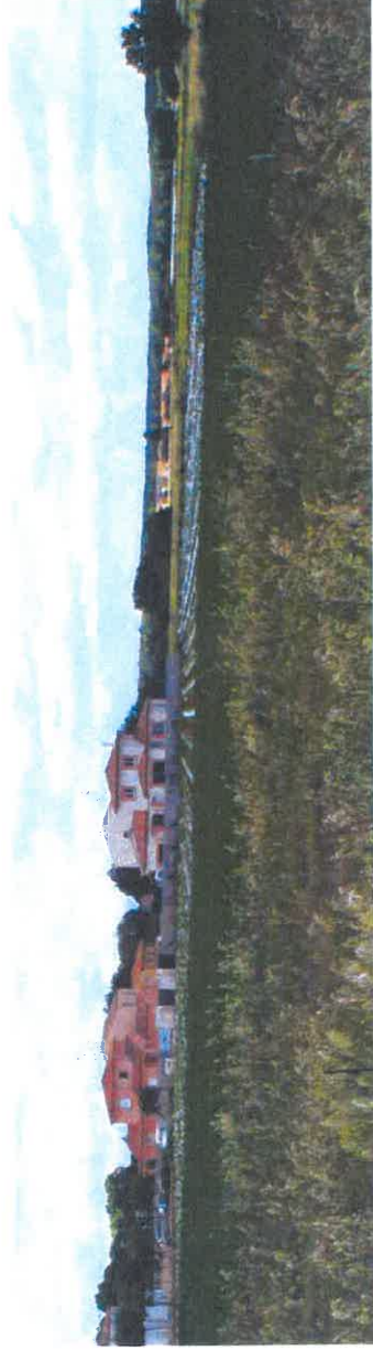
Occupation agricole actuelle du site des Conques en limite de la zone urbanisée