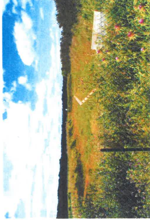
Bassin de régulation des eaux pluviales existant