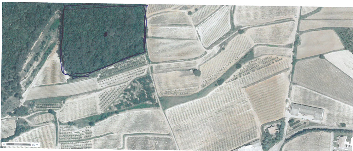
Photo aérienne montrant les Absorbeurs la parcelle. les parcelles sont toutes plantées en vigne ou arbre fruitier (abricotier)