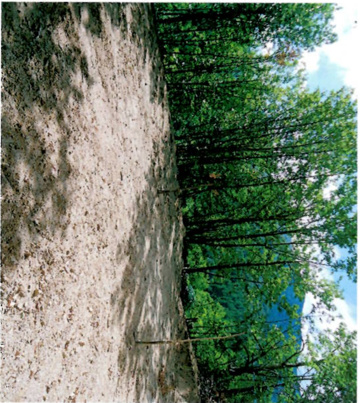
Vue du terrain prise sur l'emplacement de la construction