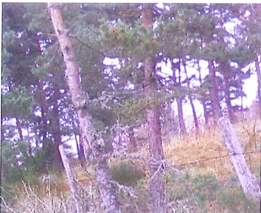
Le 21/11/2012