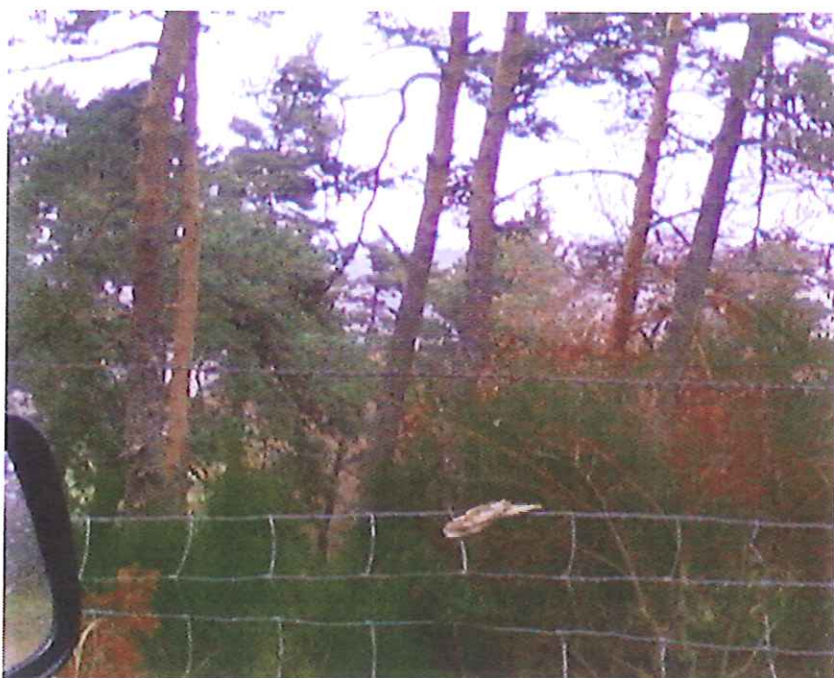
Le 21/11/2012