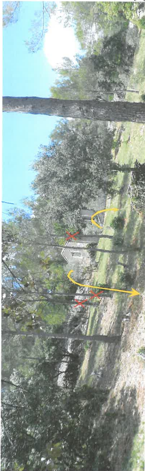
Vue depuis le fond de la combe