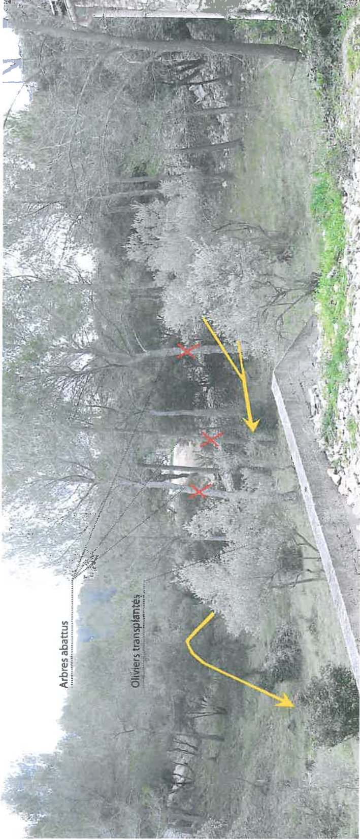
Vue depuis le haut du terrain