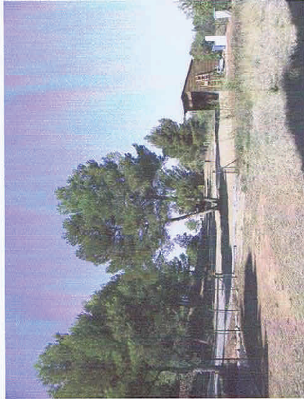
Vue 1. En direction de l'entrée vers l'Ouest