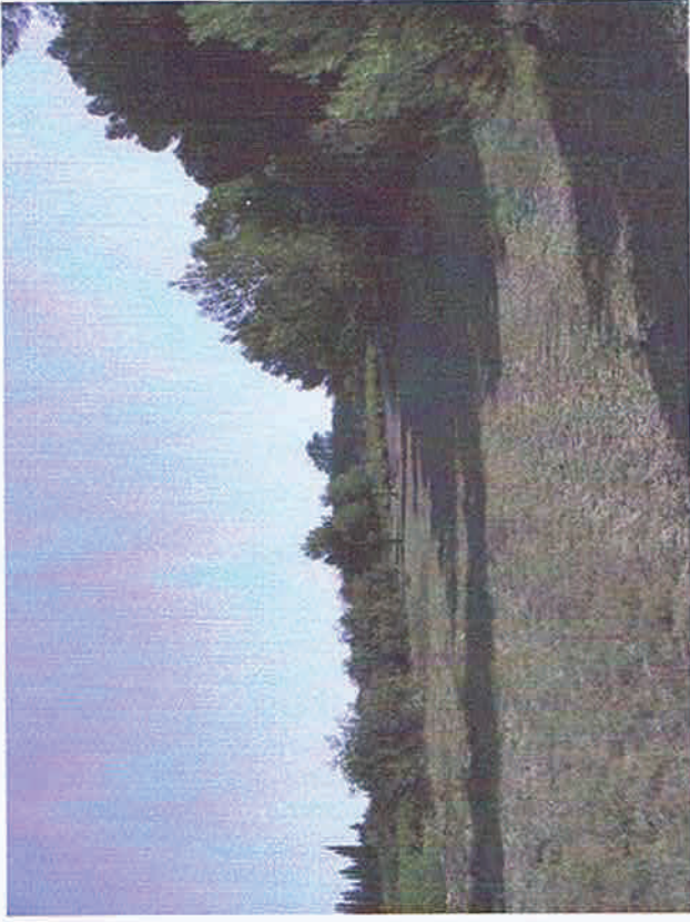
Vue 2. En direction de l'Est, au milieu du terrain en partie basse