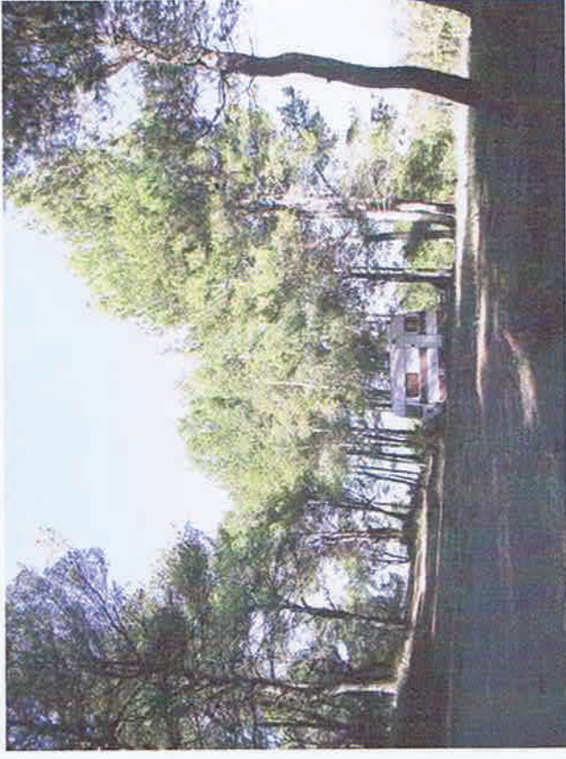
Vue 4. En direction de l'Ouest, au milieu du terrain en partie haute