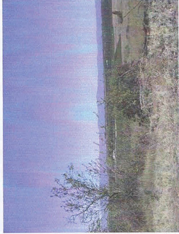
Vue 3. En direction du Nord vue des parcelles voisines et du paysage lointain