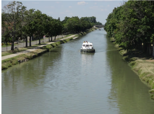
Le canal de Garonne à Grisolles, présentation de la liaison entre la gare et le bourg et navigation sur le canal