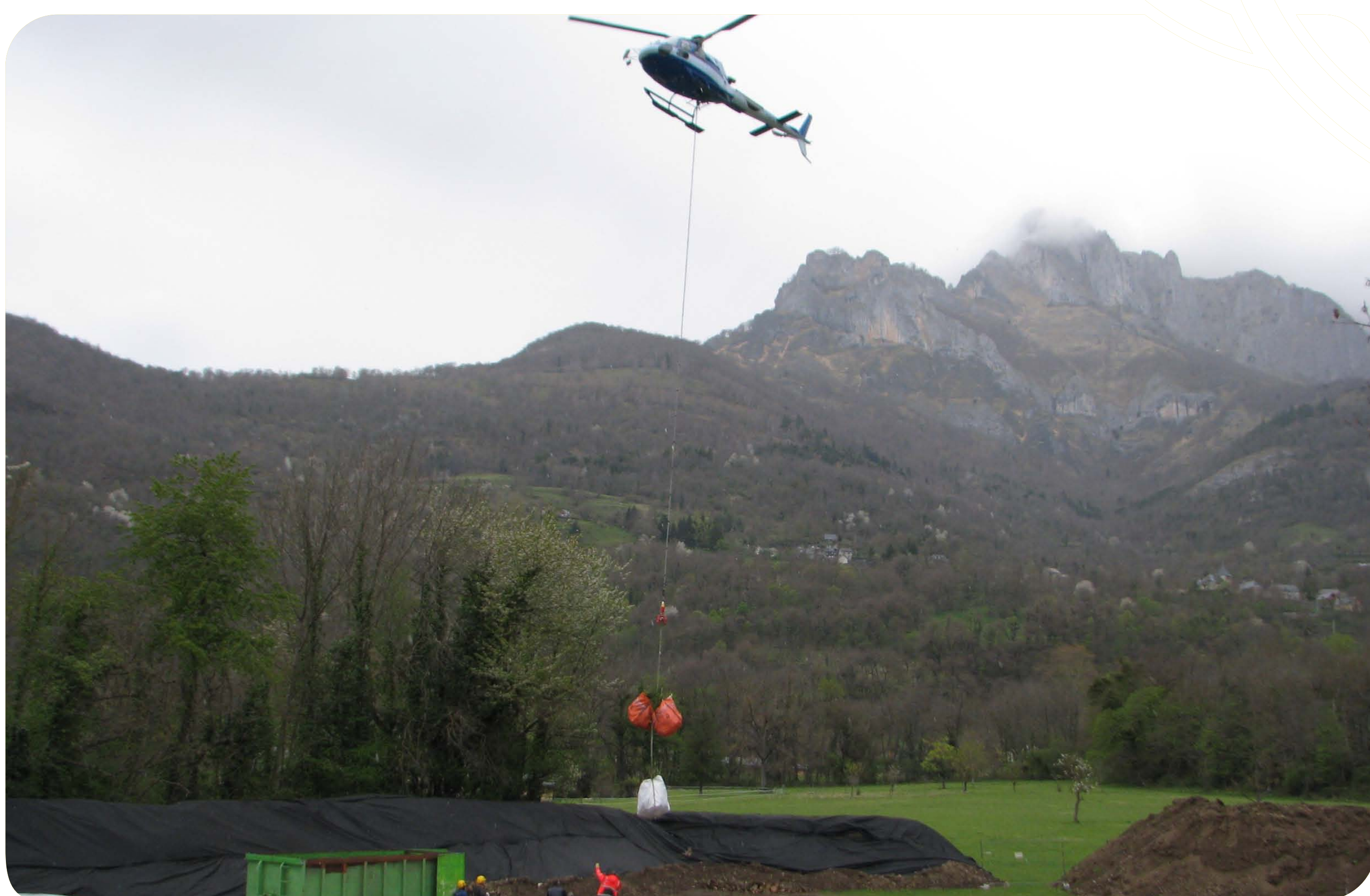
Les outils et matériaux sont apportés et évacués par hélicoptère, ainsi que les déchets verts pour éviter tout risque d'incendie et d'enrichissement des sols par un apport excessif en matière végétale.

Un chantier exemplaire au bilan environnemental neutre ; tous les genévriers protégés ont été préservés.