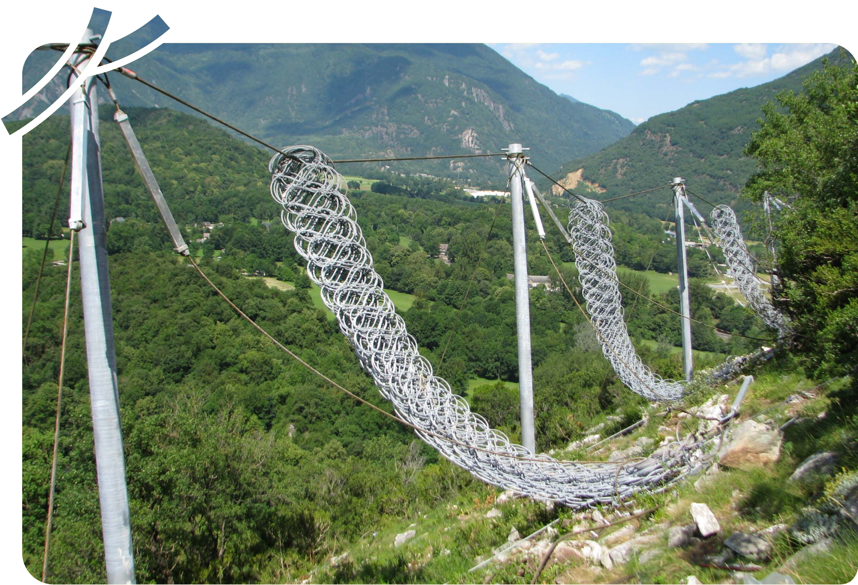
Une installation des écrans respectueuse de l'environnement en limitant l'impact au sol

Ces travaux ont pris en compte des enjeux environnementaux importants avec notamment la présence de genévriers oxycèdres et thurifères, espèces rares et protégées.