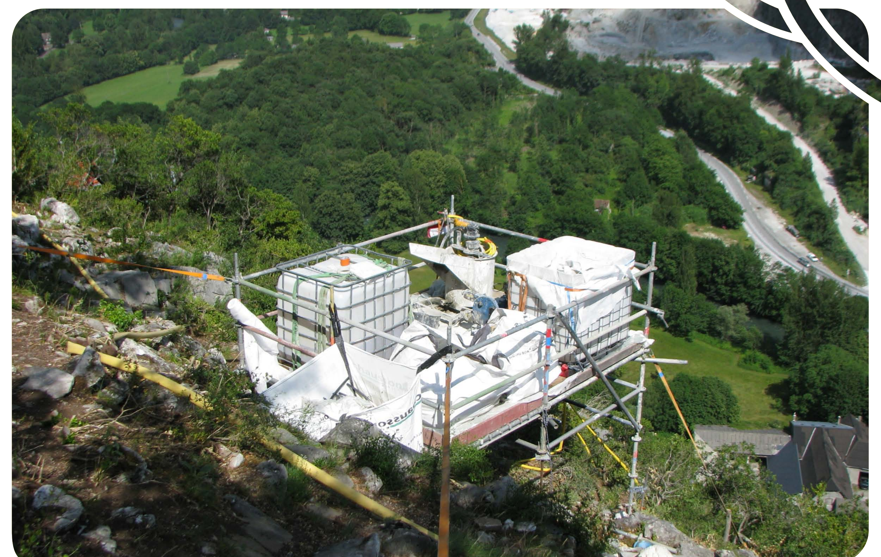
Des plateformes de travail permettent une solution mobile sans terrassement pour entreposer du matériel et, confectionner les coulis de scellement* dans des conditions respectueuses de l'environnement.