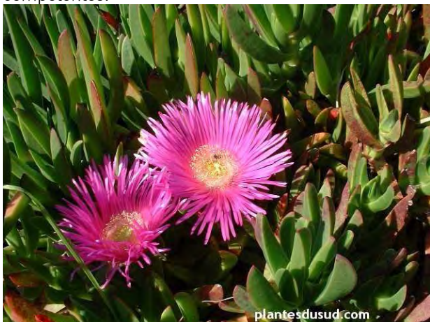
La Griffe de sorcière, une plante envahissante présente aux Coussoules notamment

« ...est interdite l'introduction dans le milieu naturel, volontaire, par négligence ou par imprudence : de tout spécimen d'une espèce animale ou végétale à la fois non indigène au territoire d'introduction et non domestique ou non cultivée, dont la liste est fixée par arrêté conjoint... » des autorités administratives compétentes.