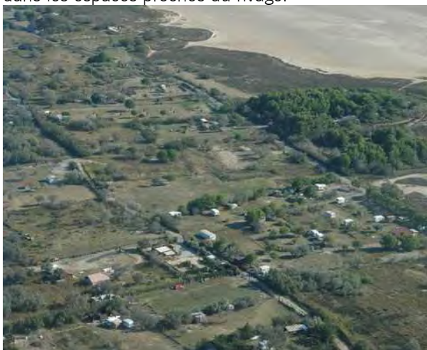
Cabanes au chemin des vignes

interdit toute construction nouvelle dans la bande des 100 mètres du rivage et limite la construction urbaine dans les espaces proches du rivage.