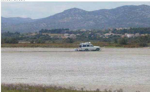
4X4 enlisé dans l'étang asséché en 2006

La circulation des véhicules à moteur n'est autorisée que sur les voies ouvertes à la circulation publique. La pratique du hors piste est donc strictement interdite.