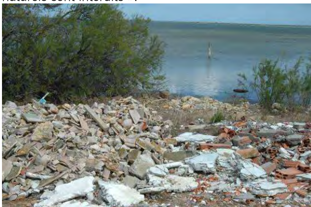
Dépôt de déchets en bordure de l'étang de La Palme

« le dépôt et l'abandon de déchets dans les espaces naturels sont interdits ».