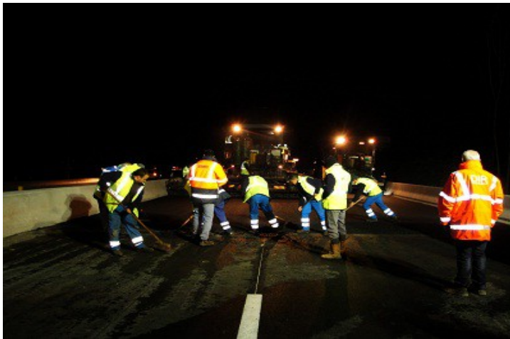
Travaux de nuit