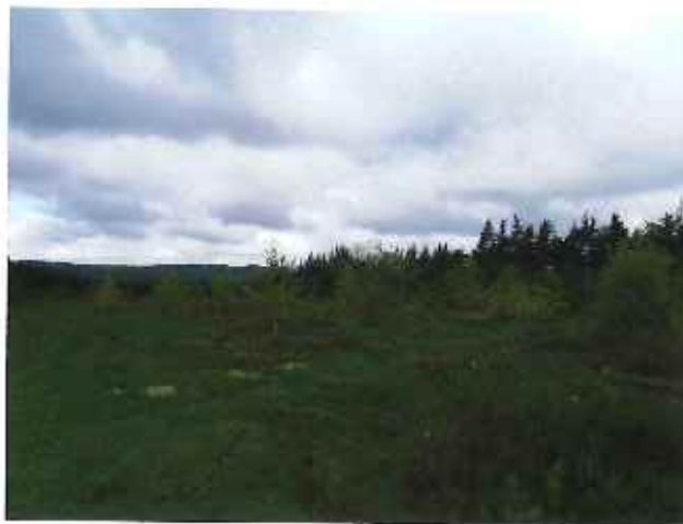
Vue 2 : ZP 5 et 7 – Ancienne futaie défrichée (31 mai 2013)