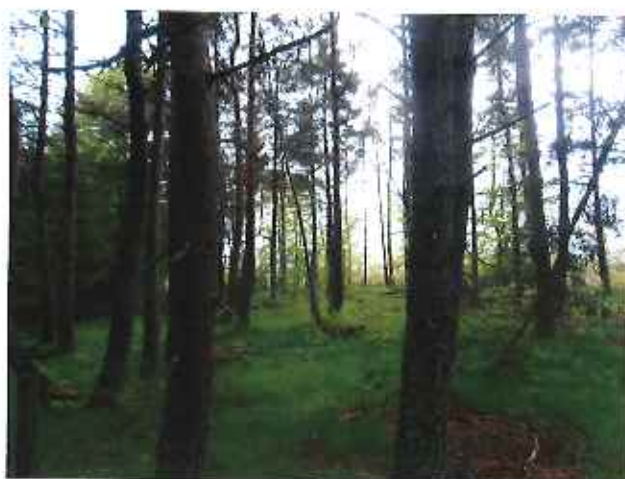
Vue 4 : ZP 8 – Futaie pin sylvestre, hêtre (31 mai 2013)