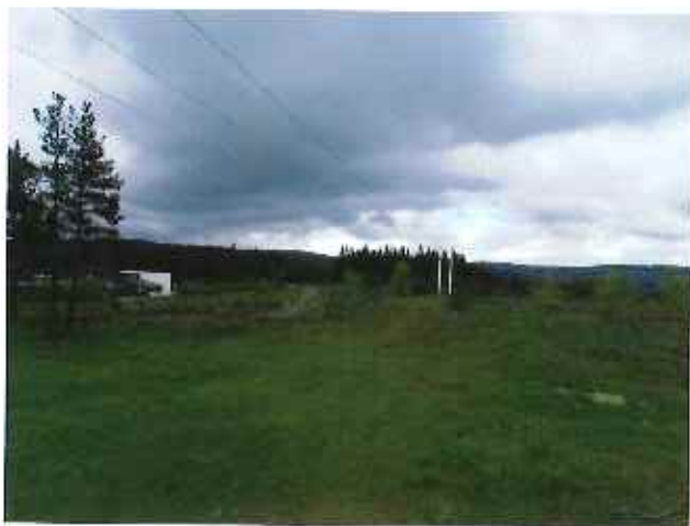
Vue 1 : ZP 5 – Phase 1 de l'aménagement – Zone pâturée (31 mai 2013)