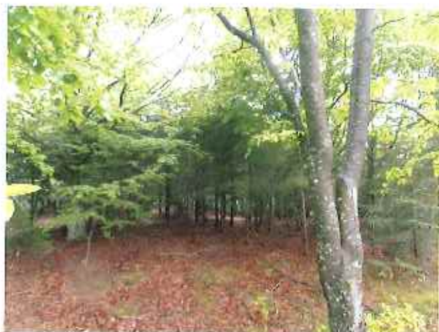
Vue 4 : ZP 9 – Futaie épicéa (31 mai 2013)