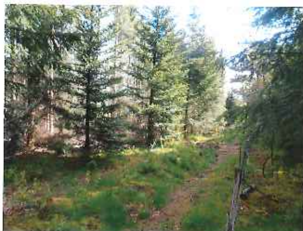
Vue 6 : limite ZP 9 – Futaie épicéa (31 mai 2013)