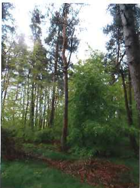
Vue 3 : ZP 8 – Futaie pin sylvestre, hêtre (31 mai 2013)