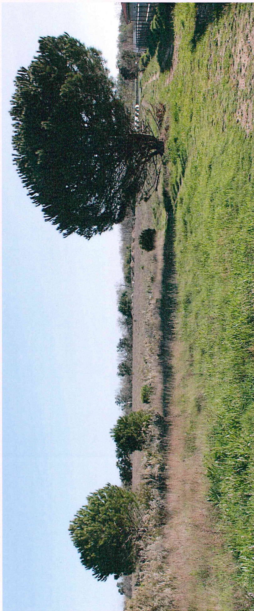
Photographie 5 : Vue du Sud vers la friche à l'Est.