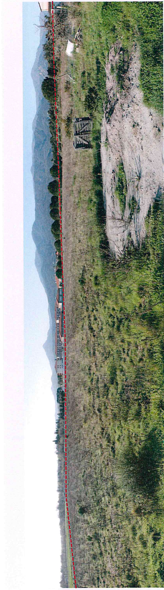
Photographie 1 : Panorama du Nord de la zone de projet vers le Sud. La friche fait entièrement partie du projet. En arrière plan, les Albères. En rouge, la limite Sud de la zone de projet.

Les photographies suivantes sont issues d'un reportage photographique réalisé le 03/04/2013.