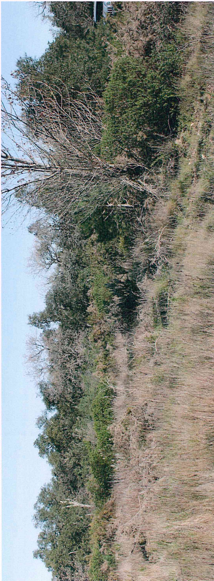
Photographie 3 : Vue de la cistaie (Maquis à Ciste de Montpellier) et en arrière-plan, la suberaie (forêt de Chênes lièges), vers le Nord.