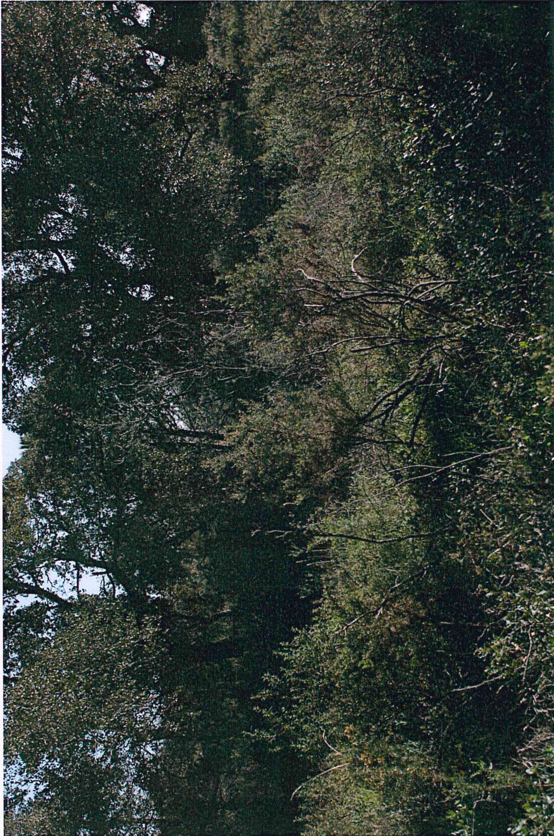
Photographie 8 : Vue de la suberaie dense au Nord