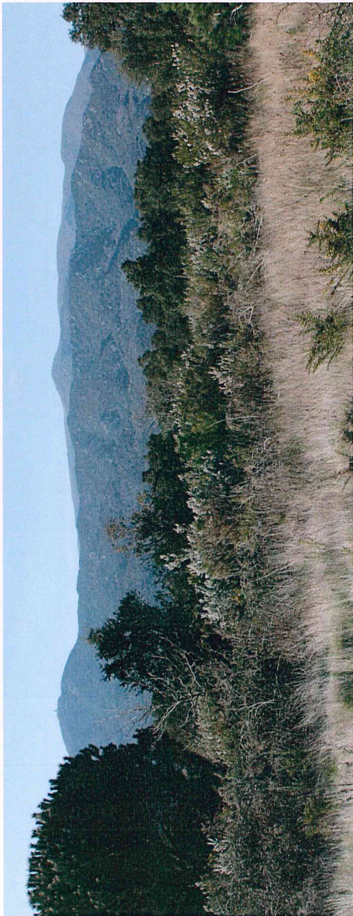
Photographie 4 : Vue vers l'Ouest de la lande à Bruyère, de la suberaie, et du massif des Albères.