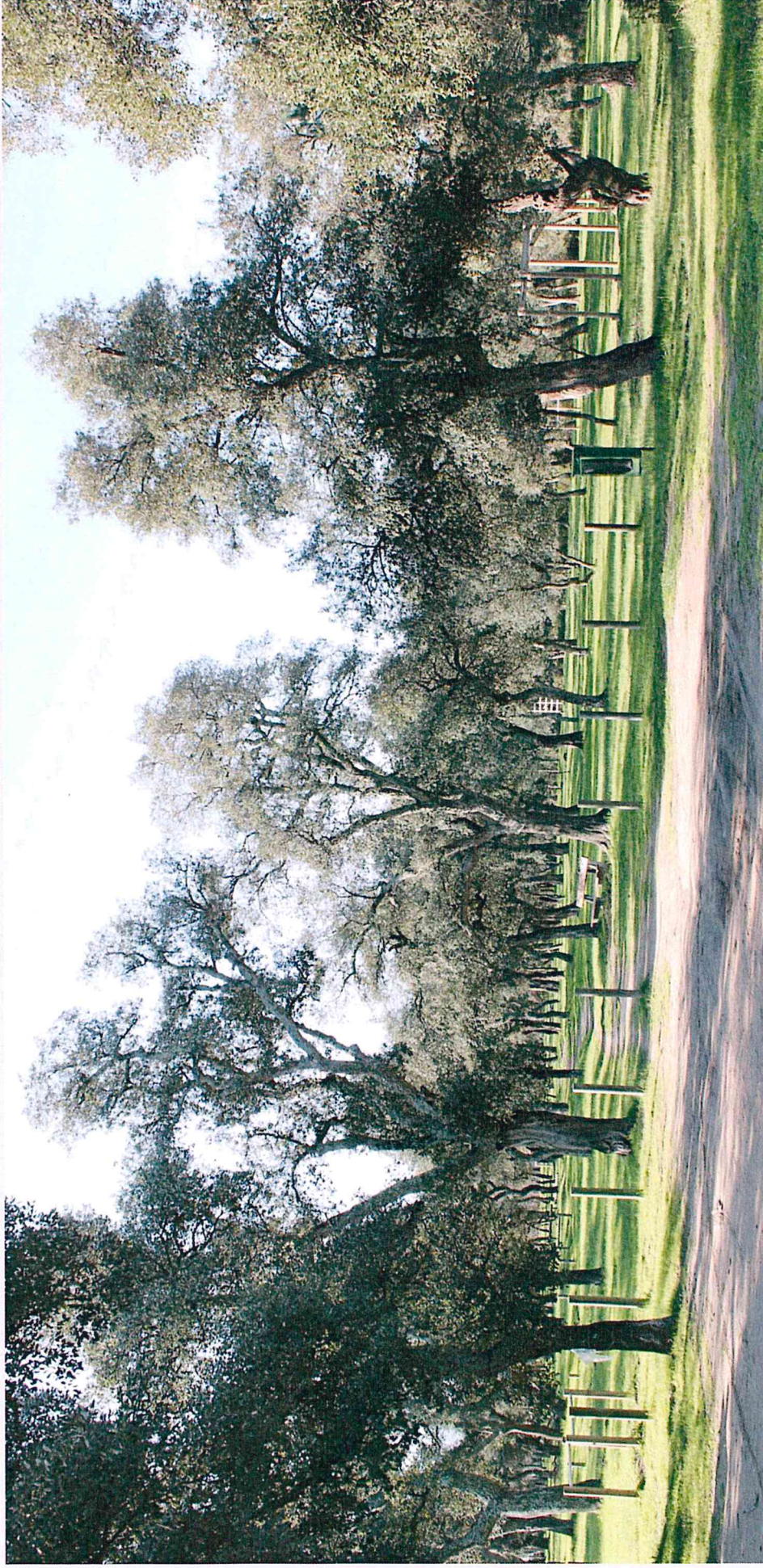
Photographie 5 : Vue de la suberaie à l'Ouest (le sous-bois a été aménagé en parcours de santé). Cette zone ne fait pas partie de la zone de projet mais la jouxte à l'Ouest.