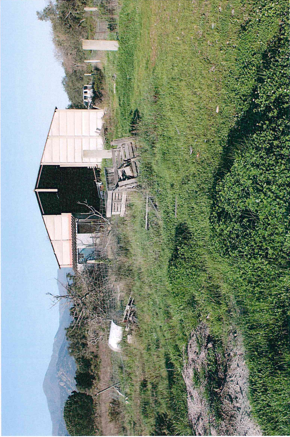
Photographie 2 : Vue du bâtiment désaffecté au Nord.