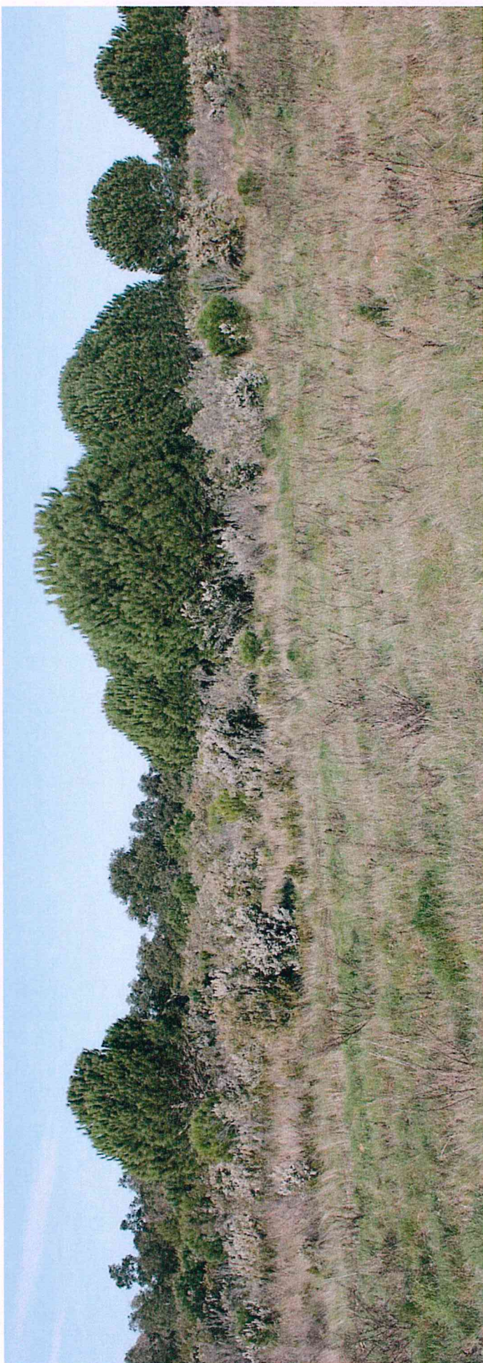
Photographie 7 : Vue de la lande à bruyère parsemée de pins vers l'Ouest.