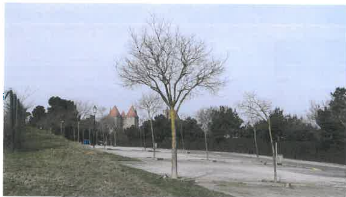
L'esplanade du parking