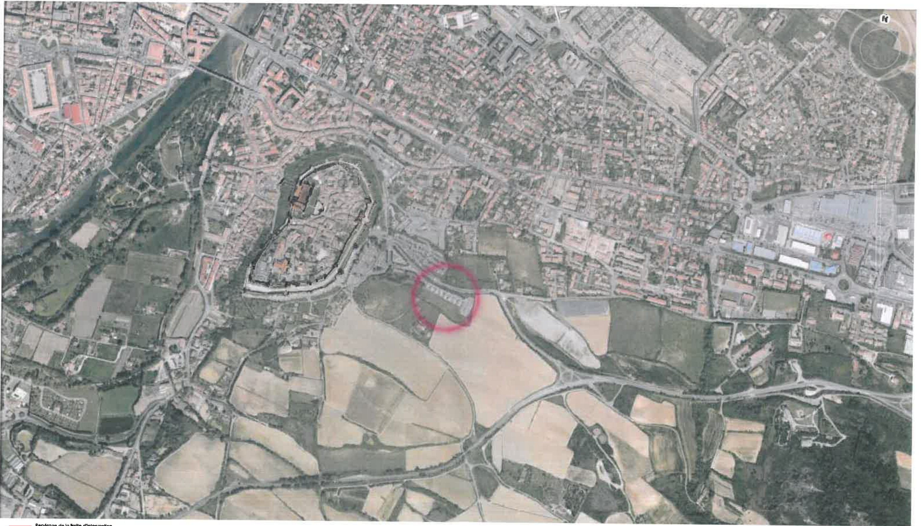
— Repérage de la limite d'intervention

Création du nouvel accès du parking Pautard et traitement paysager de l'ensemble de l'aire de stationnement. PA1. A1 _ Plan de situation Examen au cas par cas DREAL_ 28 mars 2014