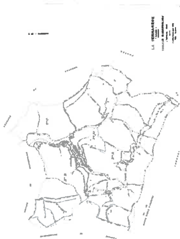
Tableau d'assemblage de la commune

Date d'édition 22-01-2013 Echelle d'origine 1 / 5 000 Echelle d'édition 1 / 1 500