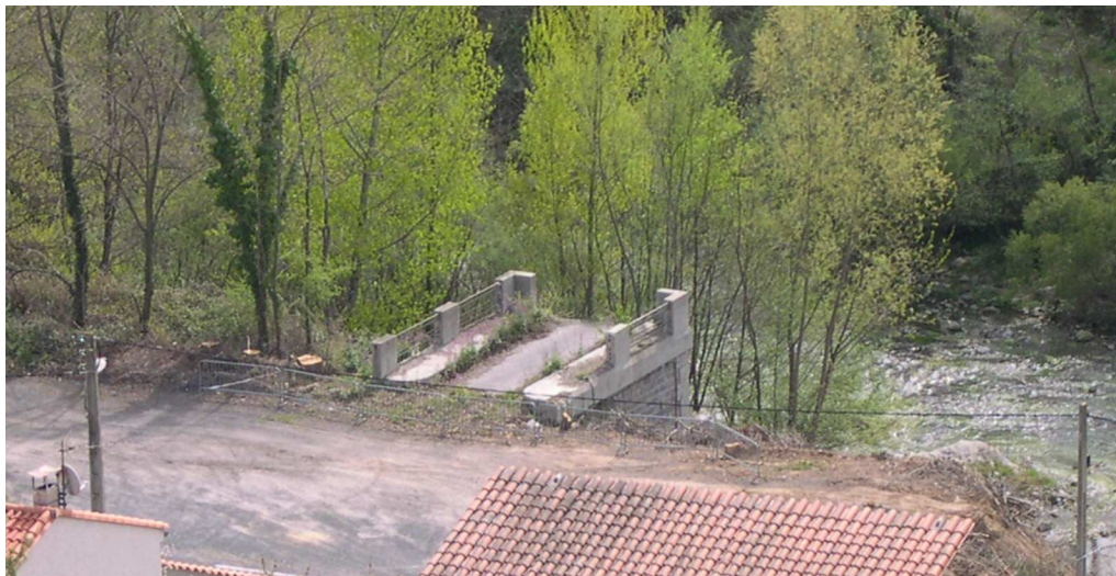
Vue de la culée rive gauche de l'ancien pont en retrait de la RD115

Vues du site (prise de vue localisée sur le plan de situation et vue aérienne)