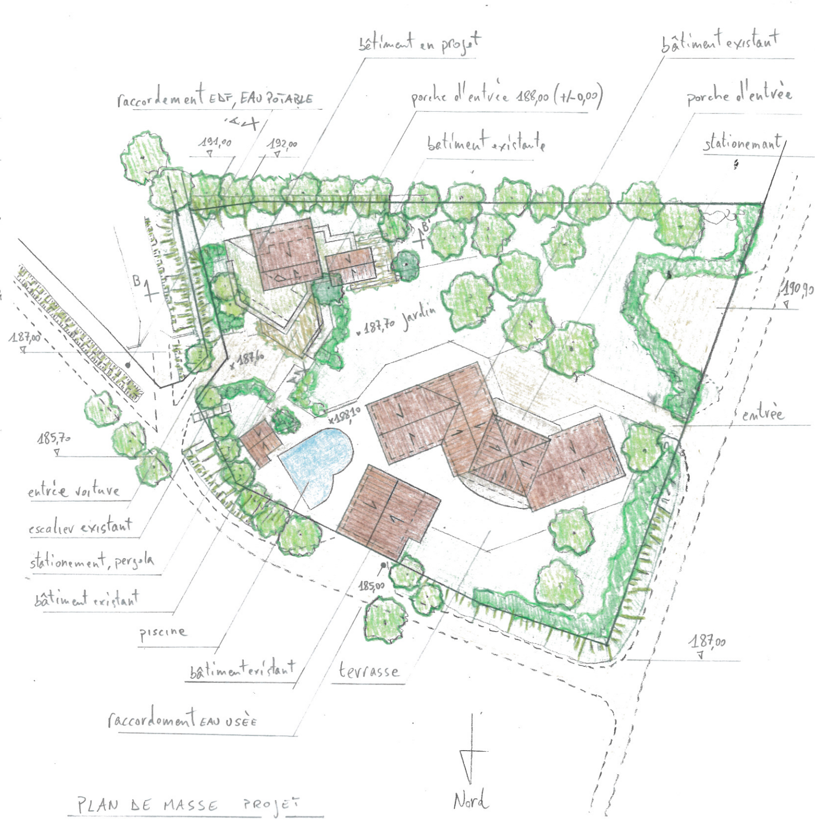
PLAN DE MASSE PROJET

Atelier d'architecture Cantercel Massimo Serrao 34520 La Vacquerie: 04 67 44 64 39 cantercel@gmail.com architecte - rénovation - paysagisme - urbaniste DPLG Polytechnique de Torino - Ordre des architectes n°76736 Siret 52484575700011 - APE 7111Z