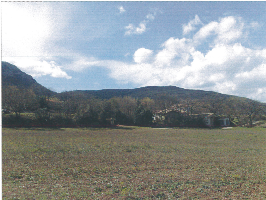
PHOTO DU TERRAIN DANS LE PAYSAGE LOINTAIN PCMI 8