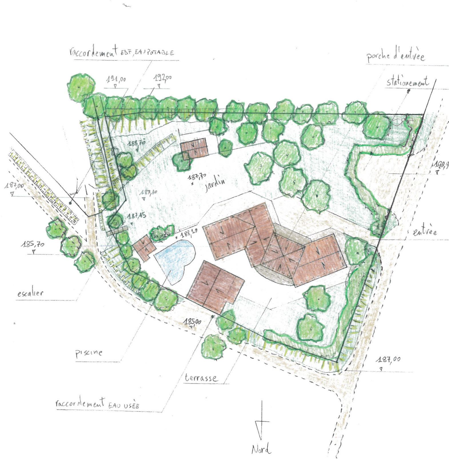
PLAN DE MASSE ETAT EXISTANT