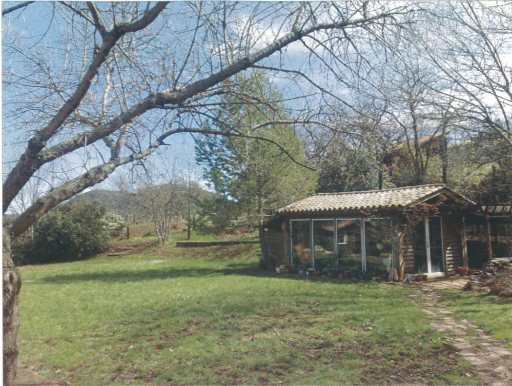
PHOTO DU TERRAIN DANS L'ENVIRONNEMENT PROCHE PCMI 7