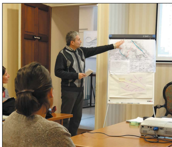
Journée thématique d'échanges du 14 novembre 2013 : restitution en salle

Cette parole donnée aux habitants de l'Arize n'attend qu'à se prolonger par un meilleur accord à l'atlas des paysages et à une traduction dans les futurs documents d'urbanisme comme autant de repères et d'enjeux pour un patrimoine vivant, support de qualité de vie.