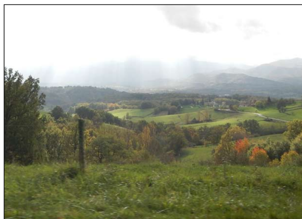
Paysage du Volvestre