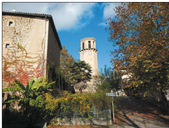
Paysage du Volvestre