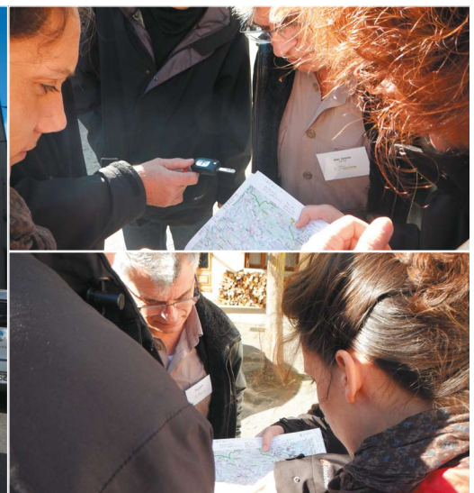
Journée thématique d'échanges du 14 novembre 2013 : exercice de terrain