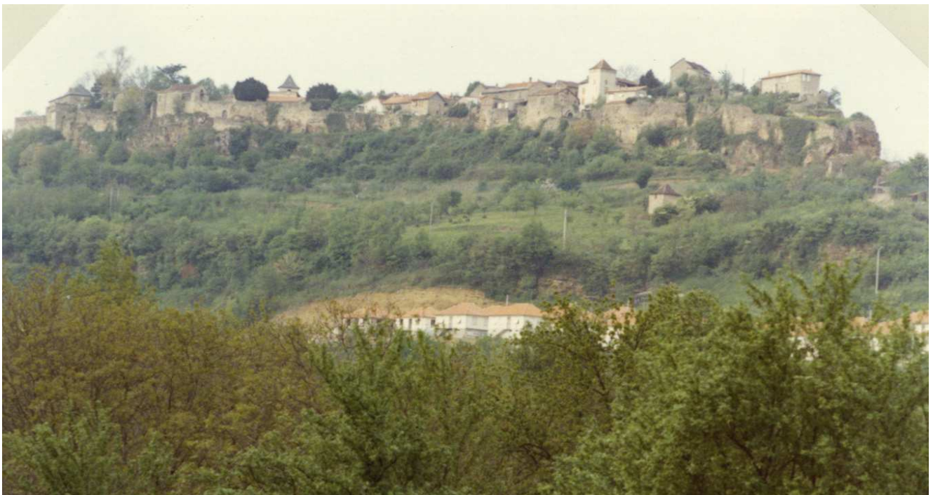
Vue globale du village de Capdenac-le-Haut