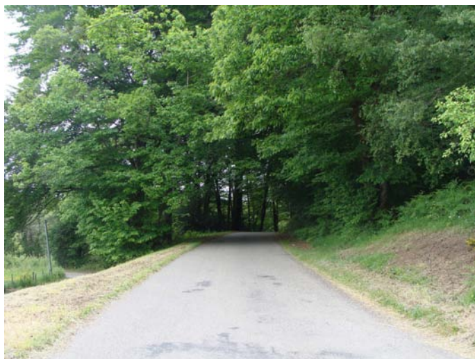
L'orée du bois avec ses grands hêtres

La gestion de la forêt, restaurée après la tempête de 1999, doit être particulièrement adaptée pour lui conserver son caractère unique et ses belles futaies. Les points de vue depuis la forêt sur le village méritent d'être maintenus.