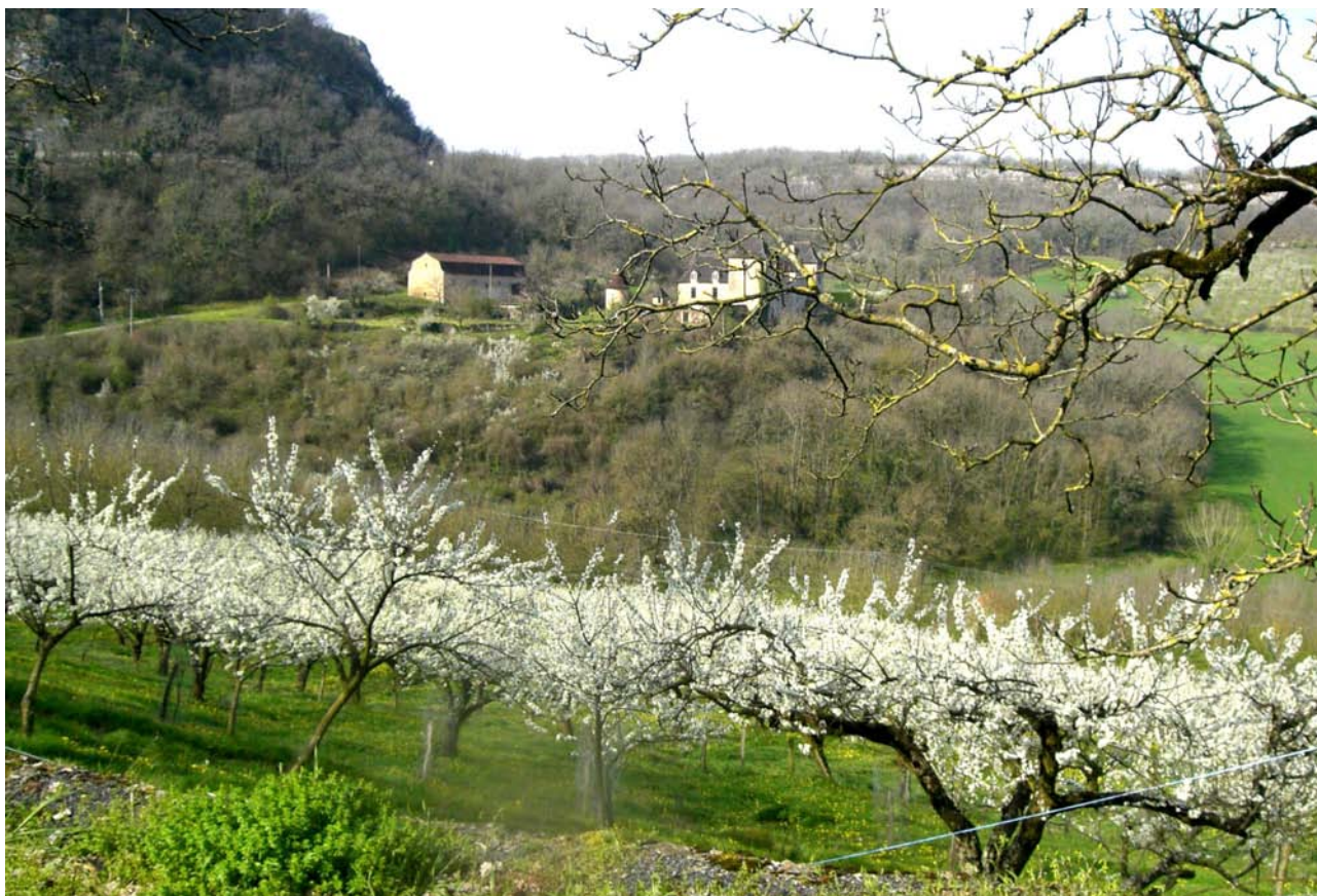
Le château de Presque édifié sur une éminence de la reculée, domine la vallée.