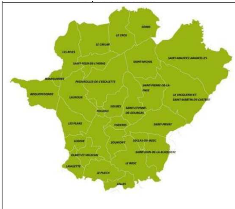
Périmètre de l'OPAH intercommunale communautaire

Exemple de périmètre : Opération de revitalisation du centre bourg de Lodève et de développement du territoire du Lodévois et Larzac