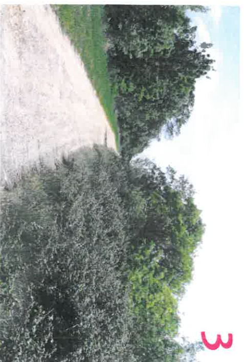
Localisation des prises de vue