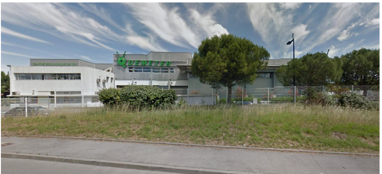
2) Vue sur le centre de tri actuel depuis l'Avenue de Maurin (2016)