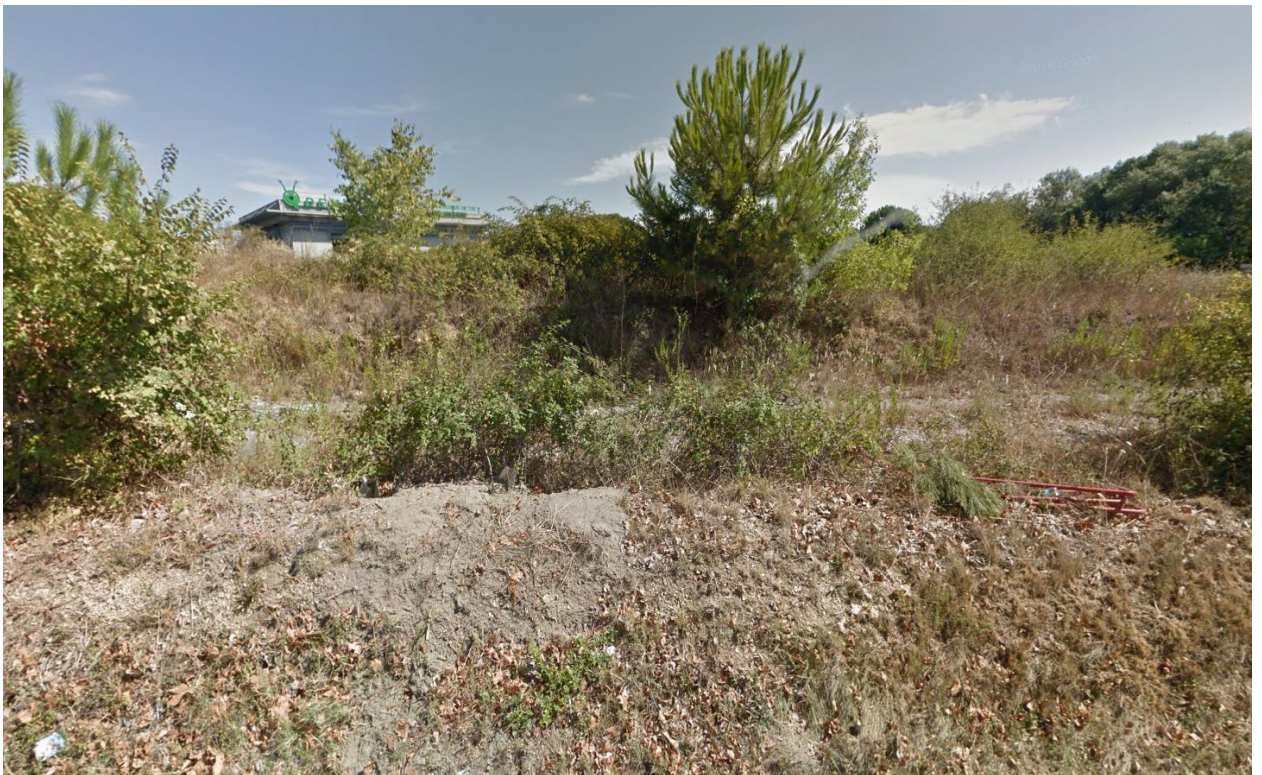
4) Vue sur le terrain du projet depuis l'Avenue de Maurin (2016)