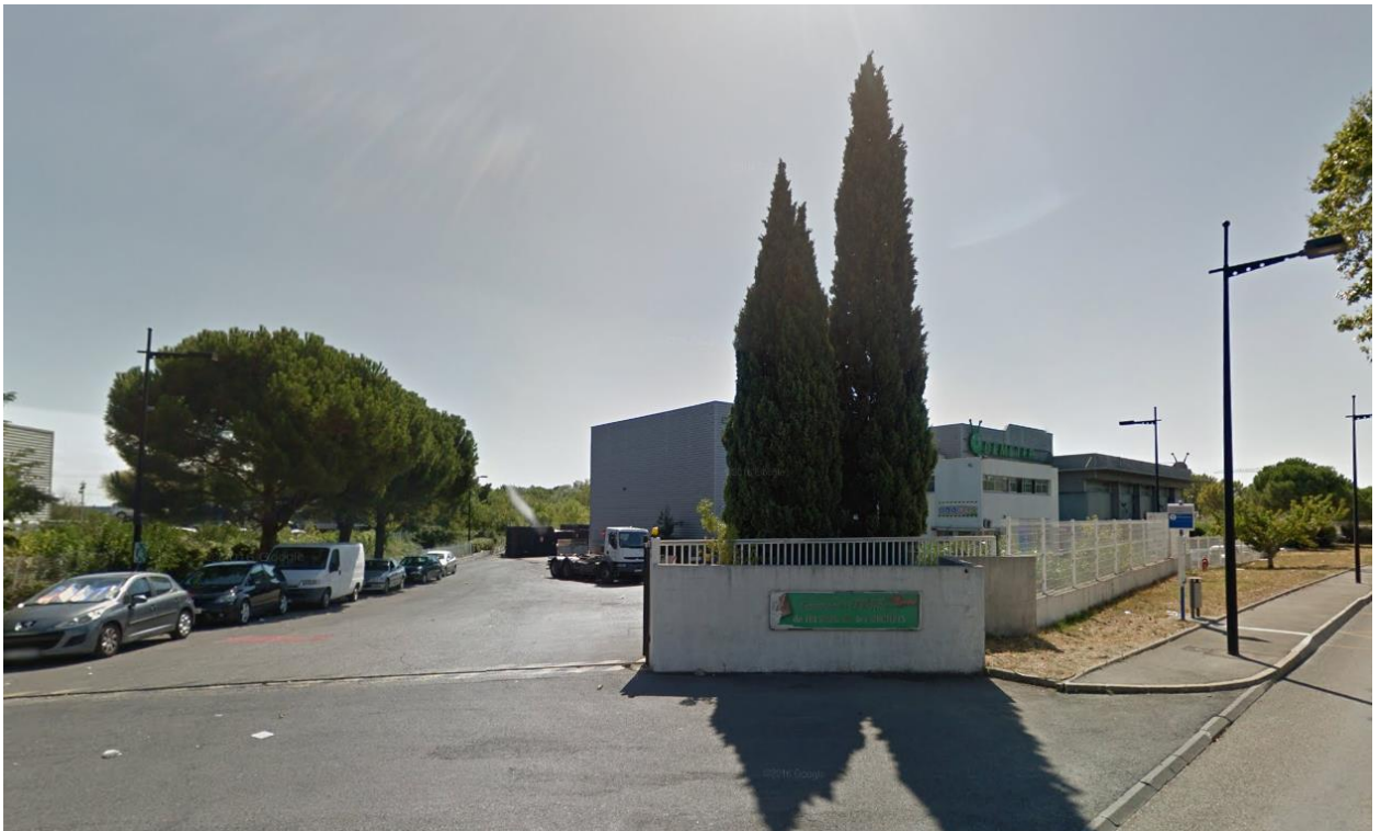
1) Vue de l'entrée du centre de tri DEMETER depuis l'Avenue de Maurin (2016)