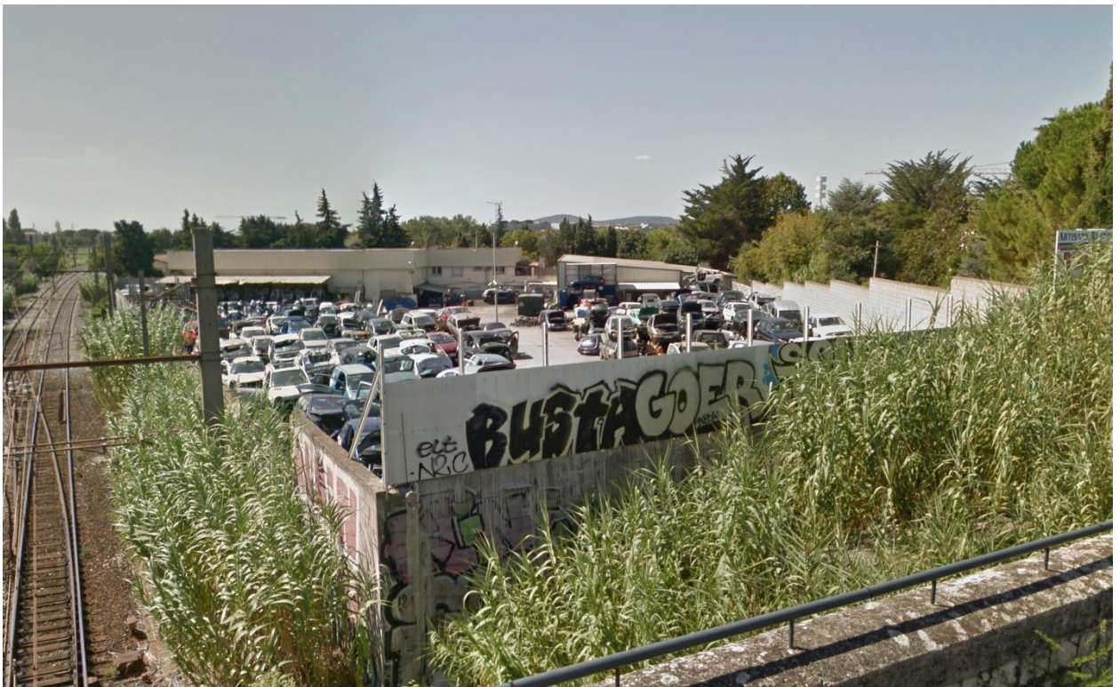
6) Vue depuis la rue de Montels Saint Pierre, au niveau du pont-route franchissant les voies ferrées (2016)