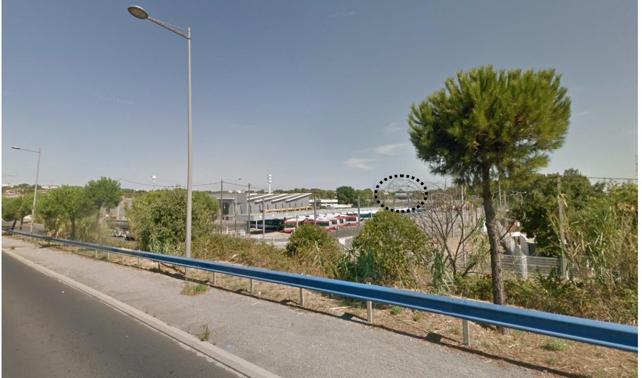
5) Vue depuis la RD65, juste après le pont-route franchissant les voies ferrées (2016)

Du fait de la topographie plane et de la végétation existante, le site est très peu visible depuis les vues lointaines.