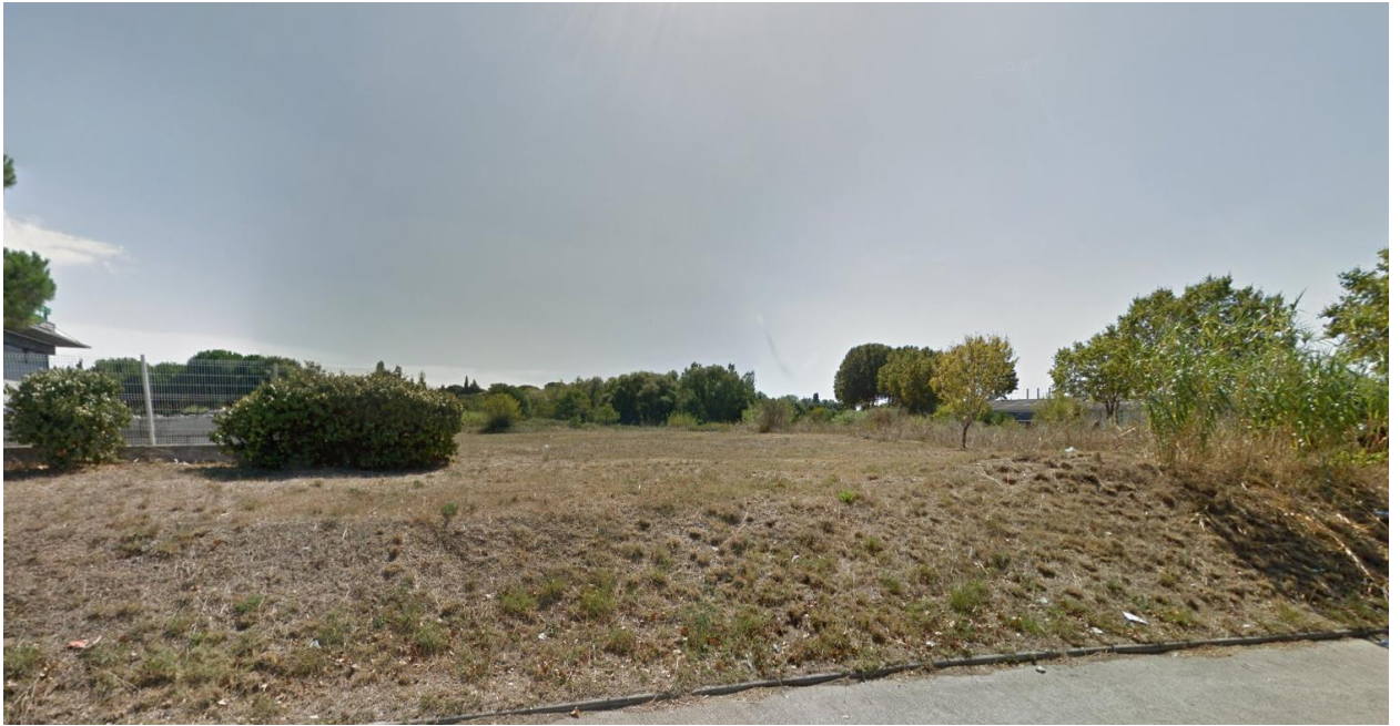
3) Vue sur le terrain du projet depuis l'Avenue de Maurin (2016)