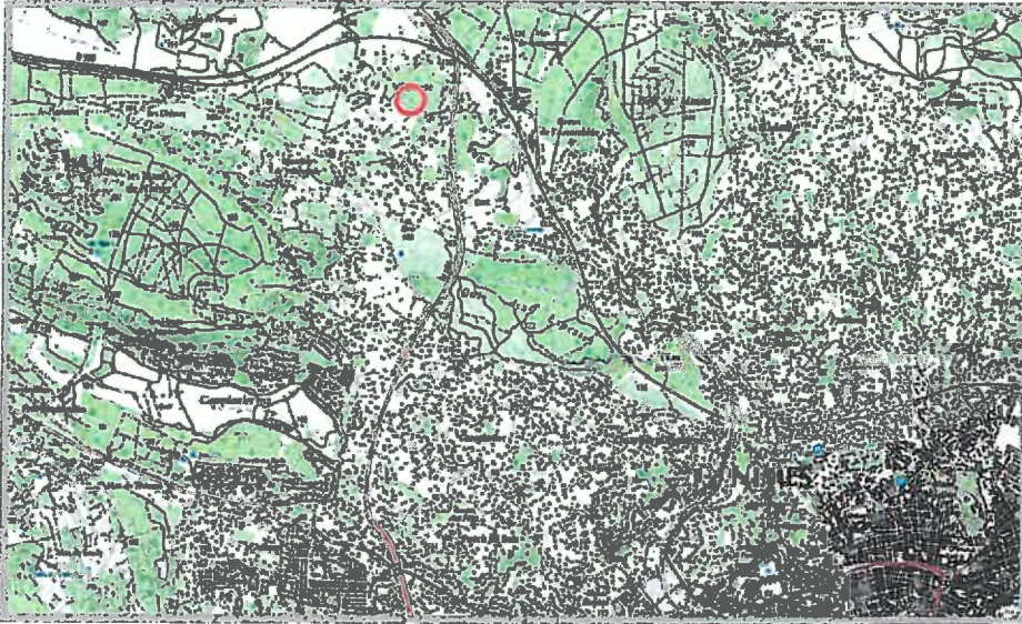
Extrait de carte IGN Echelle 1/50000