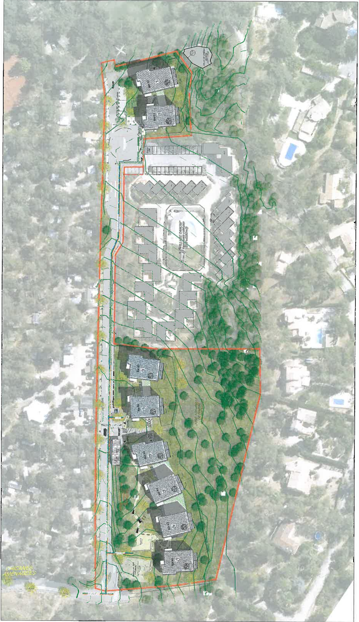
SOLEIL DES GARRIGUES - PLAN DE MASSE - Ech 1/1000