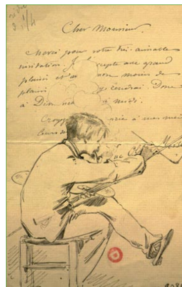
Photo : Lettre autographe du peintre Luc-Olivier Merson (1846-1920) mécénat de la société BIC pour le catalogage et la numérisation de lettres et d'autographes d'artistes conservés à la Bibliothèque de l'INHA - collections Jacques Doucet.