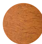
Torchis (enduit naturel)