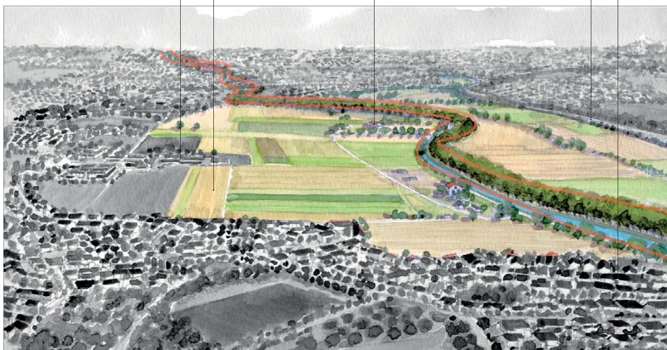
LE SILLON LAURAGAIS PÉRIURBAIN

Les limites du site sont matérialisées par l'autoroute. Le sillon est le secteur où se concentrent les grandes infrastructures : le Canal serpente ici entre la route D813 et l'A61.