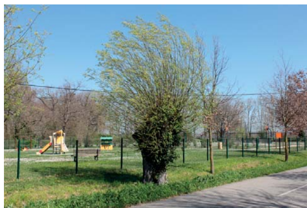
Zones de loisirs