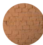
Adobe (brique terre crue)