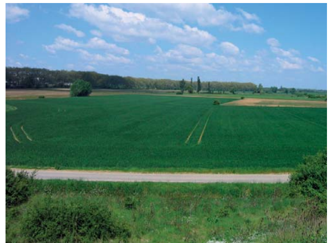
Le sillon lauragais périurbain : un territoire de céréaliculture

Cet ensemble paysager, vallée à la riche agriculture céréalière et grand couloir de circulation, est en pleine évolution, avec l'expansion de l'agglomération toulousaine, et le développement des infrastructures (autoroute, future LGV...), qui enserrant de plus en plus le canal du Midi.