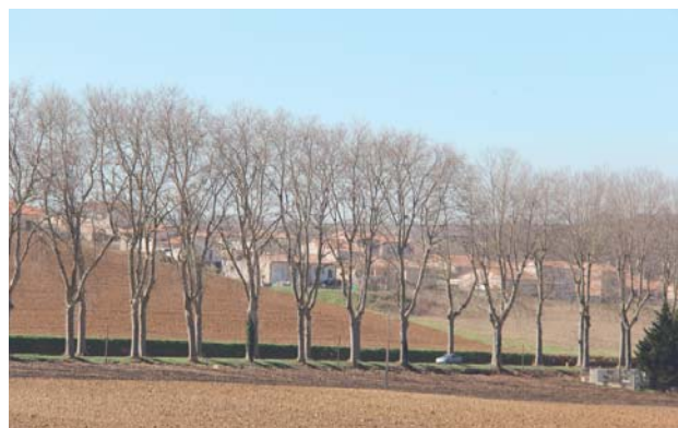
Un contexte de très forte pression urbaine

Ainsi, en continuité de l'idée d'une « coulée verte du canal » pour créer le parc linéaire de la vallée de l'Hers, le classement et la valorisation des paysages du canal du Midi dans cette unité paysagère, permettront de maintenir des interruptions de l'urbanisation entre les villages qui se succèdent le long des axes routiers et de créer un véritable parc agricole et urbain, reliant villes et villages et fédérant le territoire.