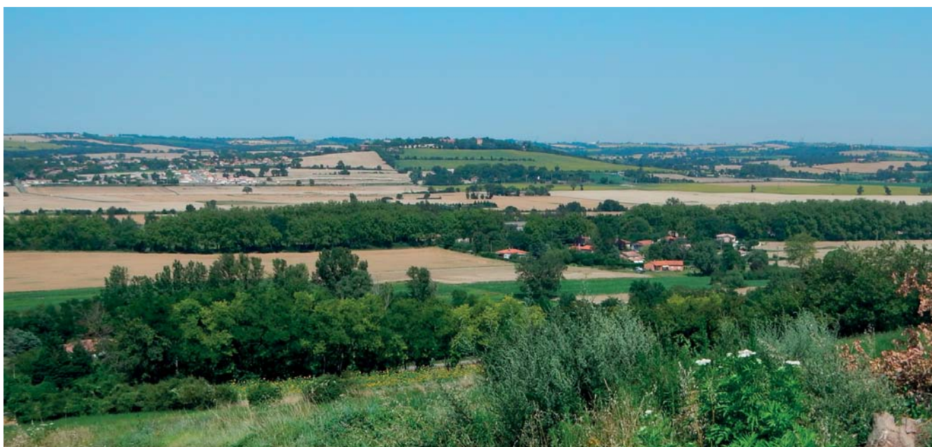
Des ouvertures visuelles sont encore préservées vers les coteaux au nord et au sud ponctués de villages

Le site classé pérennise l'installation d'une « coulée verte », la première sur cette rive sud depuis Toulouse, et une interruption d'urbanisation structurante pour la vallée, permettant de découvrir du regard le canal depuis les voies de circulation. Des ouvertures visuelles sur les coteaux sont également préservées.