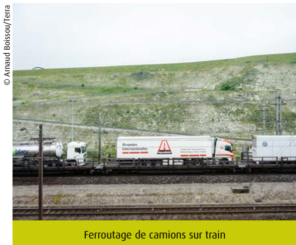
Ferroutage de camions sur train

Ce même article 36 inscrit le mode de transport des marchandises (fluvial, ferroviaire ou autre non polluant) comme critère de préférence possible d'une offre lors de marchés publics concernant le transport de marchandises, à équivalence de prix ou d'offres.