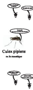
Culex pipiens ou le moustique

(Le dôme de guêpe dont l'abdomen ressemble au toit qu'il va fil.)