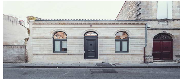
Photo d'échoppe bordelaise

les échoppes bordelaises sont des maisons basses (de plain pied), à façade en gouttereau donnant sur rue, à toiture à deux pentes couvertes en tuiles et ligne de faîtage parallèle à la façade