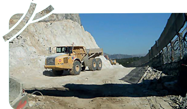
Exemple de travaux sur la pointe de Hournech

Les travaux les plus impressionnants auront lieu au niveau des grands déblais de la pointe du Hournech pour la création des plateformes routières de la RD 44e, positionnée en surplomb de la RN 125, et de la RN 125 elle-même.