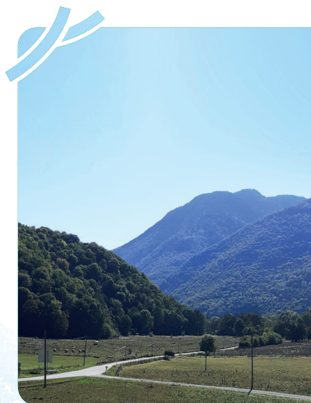
conception DREAL Occitanie/DT/DIMORNY / réalisation DIR/CC/Com-Didier Le Boulbard — édition octobre 2021

Conscient des fortes contraintes générées sur l'organisation personnelle et professionnelle des riverains d'Argut-Dessus et d'Argut-Dessous, le maître d'ouvrage les remercie pour leur compréhension.