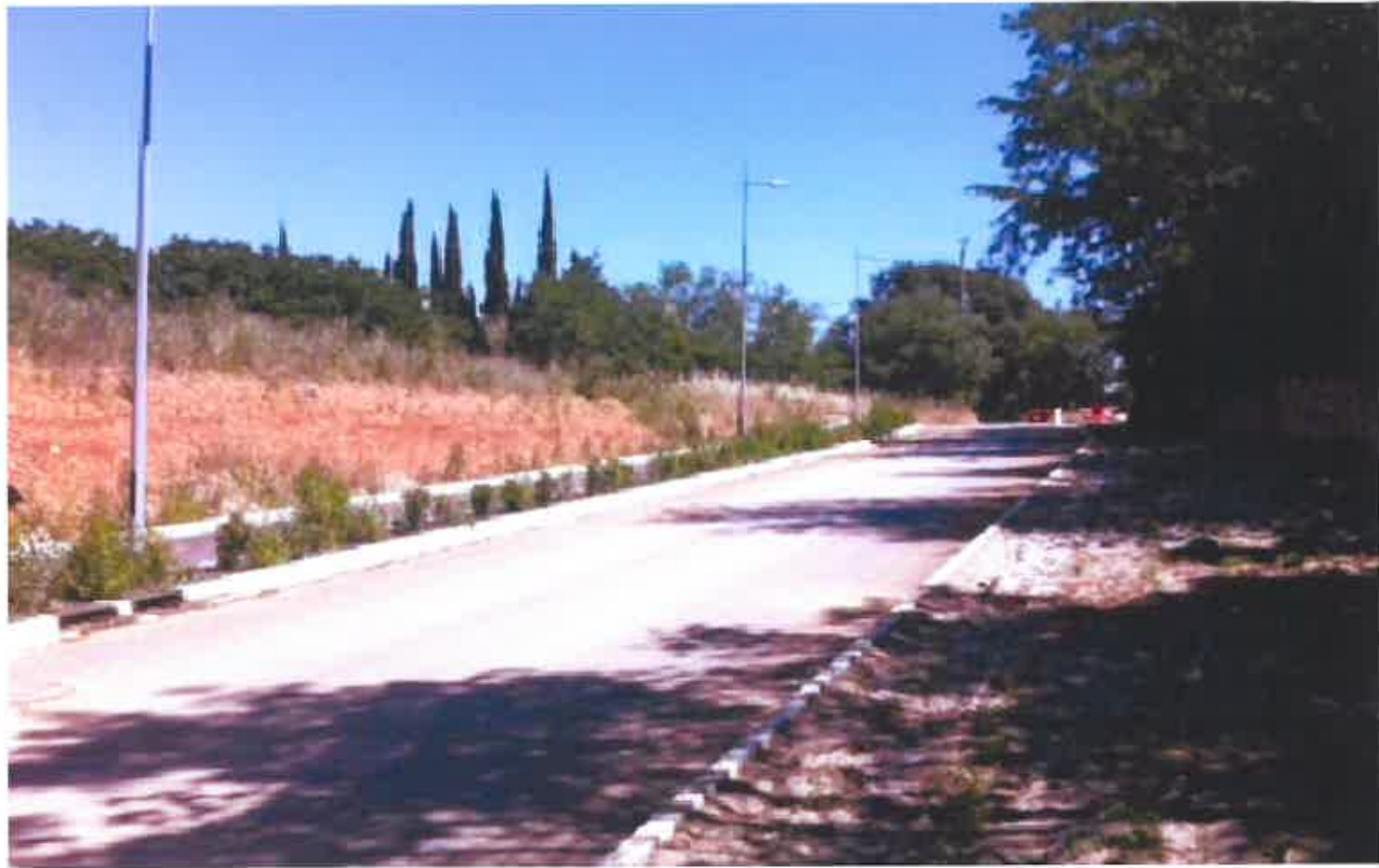
PC 07 a