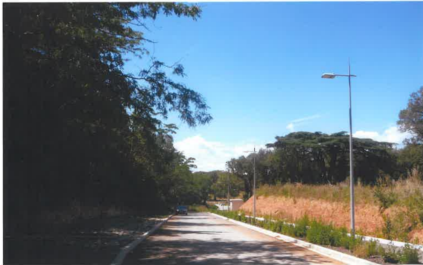
PC 07 b