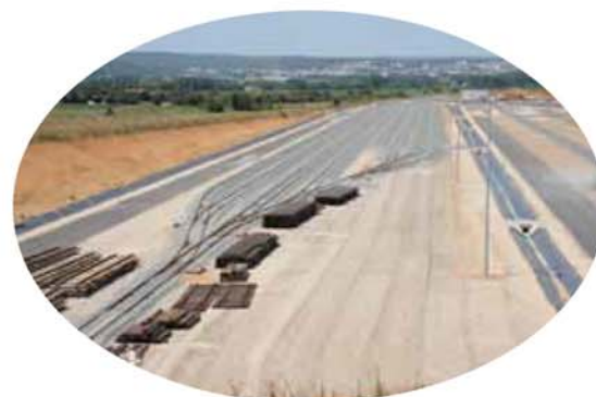
Chantier d'infrastructure linéaire.