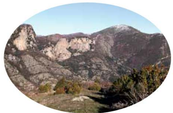
Le Caroux.

58 avenue Marie de Montpellier - 34064 Montpellier Cedex 2 0434466600