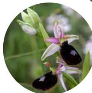
Ophrys magniflora.