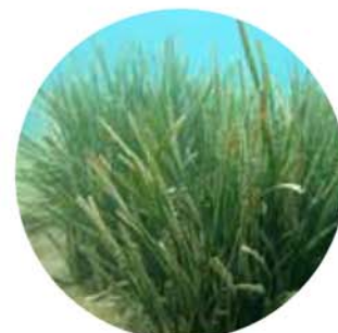
Posidonia oceanica.