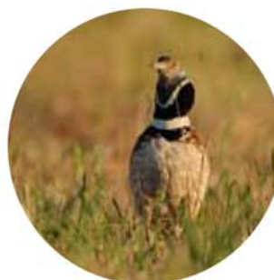
Outarde canepetière.