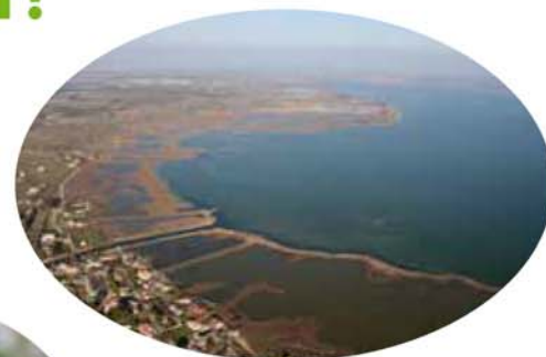
Baie de la Capoulière, 34.

La prise en compte de la biodiversité dans les différentes phases des schémas, plans, programmes et projets est un enjeu majeur !