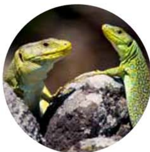
Lézards ocellés ( Timon lepidus ).

Direction Régionale de l'Environnement, de l'Aménagement et du Logement Languedoc-Roussillon-Midi-Pyrénées