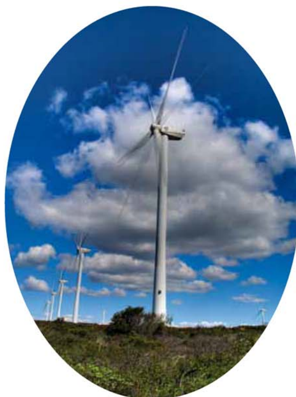
Éoliennes à Aumelas.