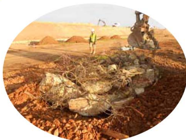
Gîte à reptiles.