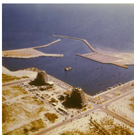
La Grande Motte pendant les travaux