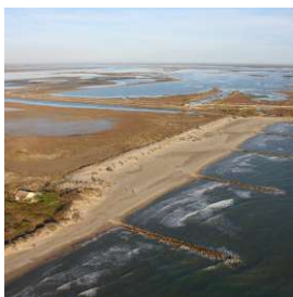
Ouvrages de protections en petite Camargue, dunes artificielles et épis en enrochements.