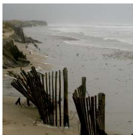
Plage du Petit Travers, pendant la tempête, avant les travaux de rechargement .