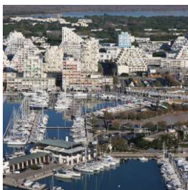
La Grande Motte actuelle