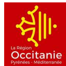
Schéma Régional Biomasse Région Occitanie Réponses aux recommandations de l'Autorité Environnementale